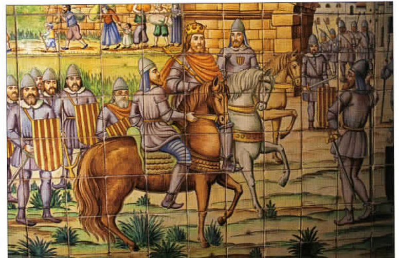
Une céramique de l'Orchateria Santa Catalina où est servie une boisson typiquement valencienne, l'Orchata de chufa.