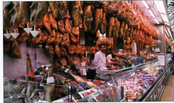
Un appétissant étalage du marché central de Valence. Un lieu haut en couleurs, parfums et bruits divers.