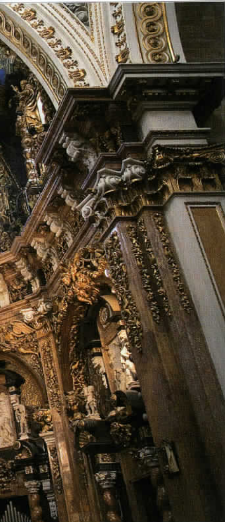
Le retable de la Capilla Mayor de la cathédrale de Valence, qui intègre deux peintures italiennes du XVI e siècle.