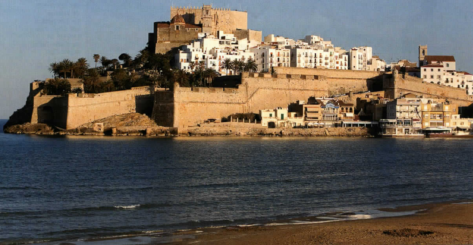
La forteresse de Peníscola, un décor connu dans le monde entier, immortalisé dans le célèbre film d'Anthony Mann « Le Ci » avec Charlton Heston dans le rôle-titre.