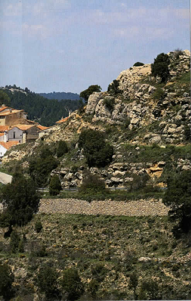
Le beau village d'Herbeset, près du parc naturel de la Tinença de Benifassà.