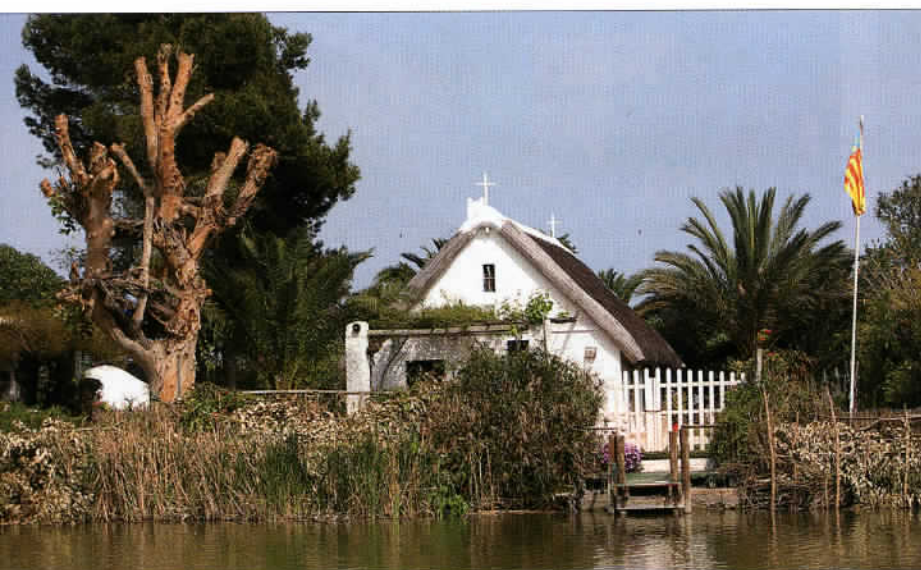
Le parc de l'Albufera à proximité de Valence. Un poumon vert constitué d'une lagune d'eau douce, de rizières et de zones de pêche.