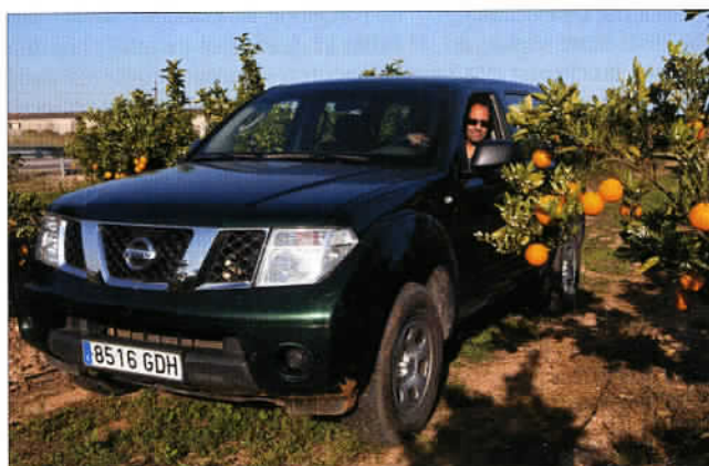
Une orangerie, la culture emblématique de la communauté de Valence.