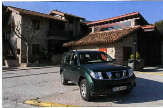
Des pistes signalisées sont ouvertes à une pratique éco-responsable du tout chemin, à travers des paysages de toute beauté et au sein d'un environnement paisible.