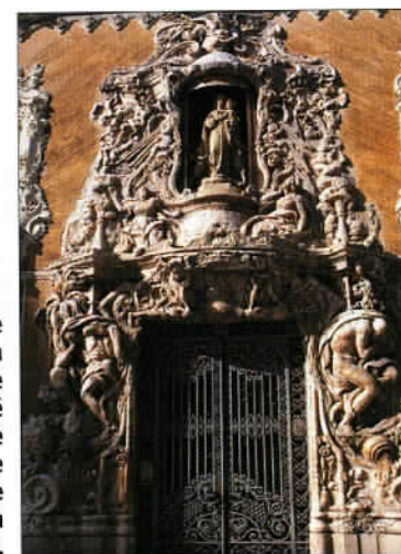
La façade du musée de la Céramique. Une particularité culturelle valencienne héritée de l'occupation arabe.