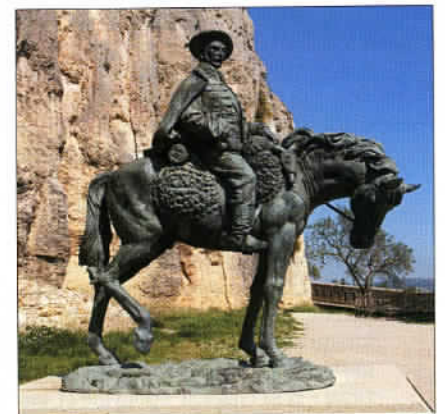
Une statue équestre située à Morella, une magnifique citadelle bâtie à plus de mille mètres d'altitude sur un socle rocheux.

munauté valencienne s'avère une destination complète